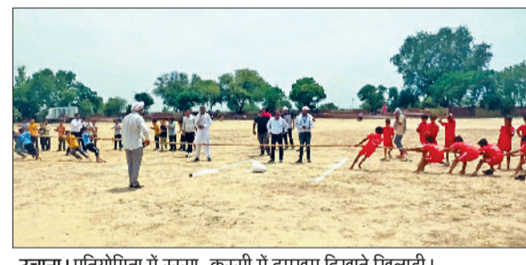
उचाना। प्रतियोगिता में रस्सा-कस्सी में दमखम दिखाते खिलाड़ी।