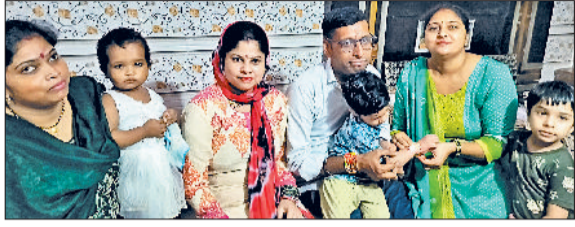
पानीपत। भाई को राखी बांधती हुई बहनें।

पानीपत जिला कारागार में रक्षाबंधन का त्यौहार बड़े ही धूमधाम से मनाया जा रहा है। कारागार में बंद कैदियों को उनकी बहनों ने कड़ी सुरक्षा के बीच राखी बांधी। वहीं, बहनों ने अपन माइयों को राखी बांधी, तिलक लगाया व मिठाई खिलाई। जबकि मिठाई और