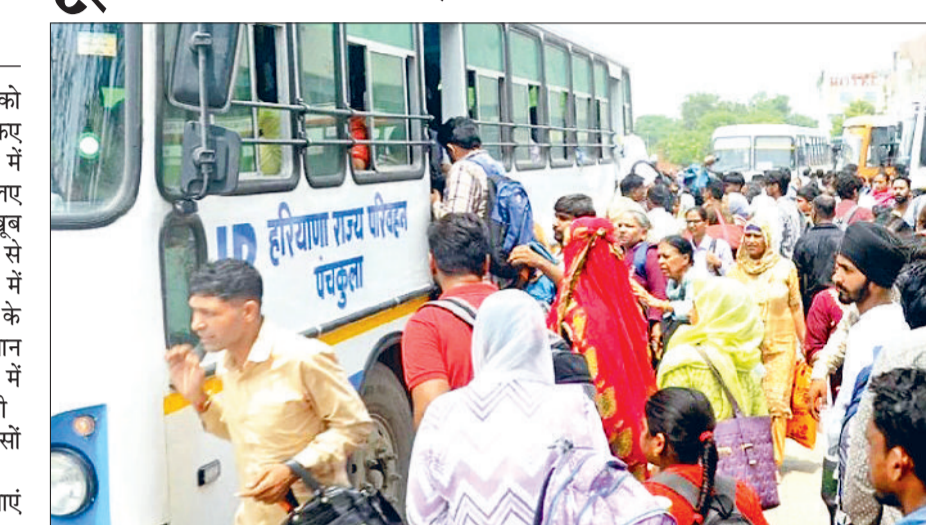
अंबाला। रक्षाबंधन पर बस में सवार होने का प्रयास करती महिलाएं।

शुक्रवार की तरह शनिवार को भी महिलाओं के साथ दूसरे यात्रियों को भी दिनभर दिल्ली जाने वाली बसों का इंतजार करना पड़ा। कई बसों में तो सवारियां भर-भर के गईं। कुछ बसों में लोगों की सीट ही नहीं मिली। चंडीगढ़ से ही ज्यादातर बसें फुल होकर आ रही थी। दूसरी तरफ परिवहन समितियों की बसों ने महिलाओं व बच्चों को निशुल्क यात्रा की सुविधा नहीं दी। इससे महिला यात्रियों की बस परिचालकों से बहस भी हुई। अंबाला रोडवेज डिपो की ओर से रक्षाबंधन के लिए 40 अतिरिक्त बसों का इस्तेमाल कुछ घंटे के लिए किया गया। इसकी वजह से भी महिलाओं व बच्चों को भीड़ से