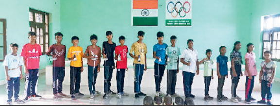
करनाल। प्रतियोगिता में भाग लेते हुए फेंसिंग खिलाड़ी।