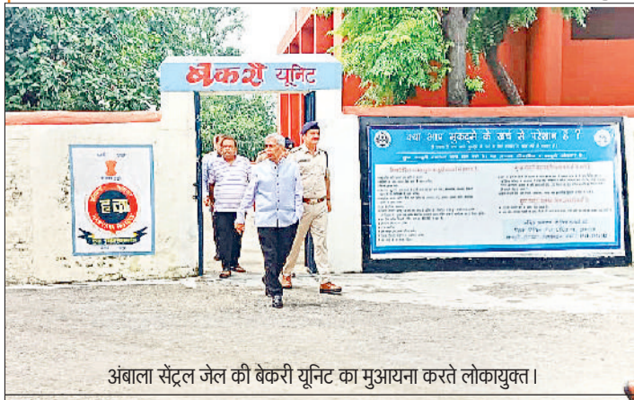
अंबाला सेंट्रल जेल की बेकरी यूनिट का मुआयना करते लोकायुक्त।