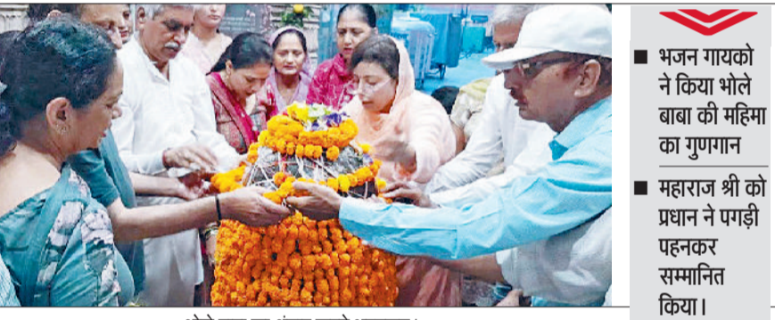
भोले बाबा का श्रृंगार करते भक्तजन।