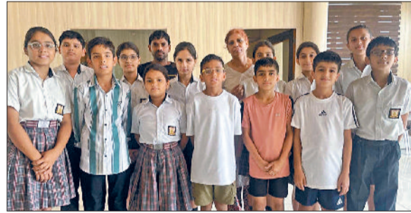
जींद। प्रतियोगिता में विजेता रहे खिलाड़ी।