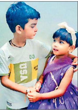
पानीपत। बड़े भाई को राखी बांधती हुई छोटी बहन।

माइयों को राखी बांधने के लिए बहनें सुबह से अपनी ससुराल के मायके के लिए रवाना होना शुरू हो गई थी। हालांकि कुछ जगहों पर