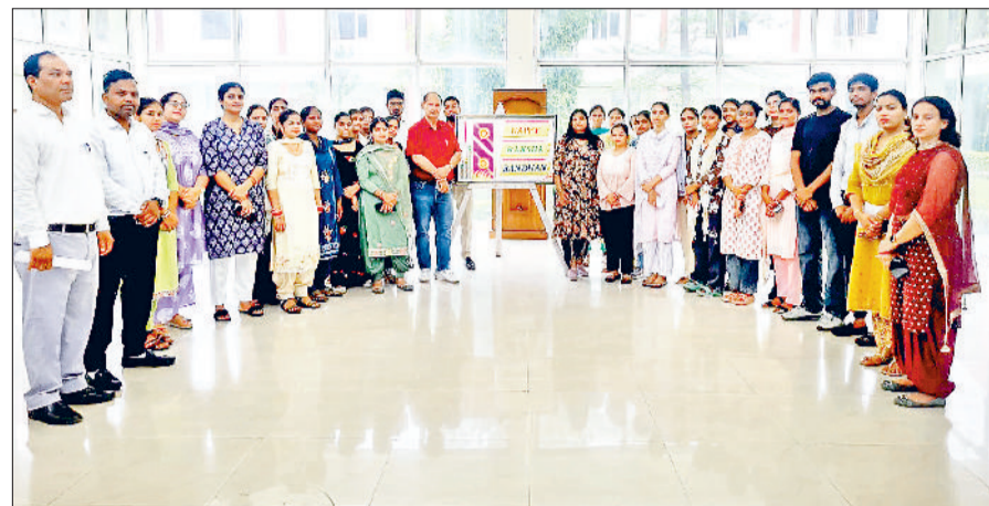
अंबाला। कार्यक्रम में उपस्थित कॉलेज स्टाफ व स्टूडेंट्स।